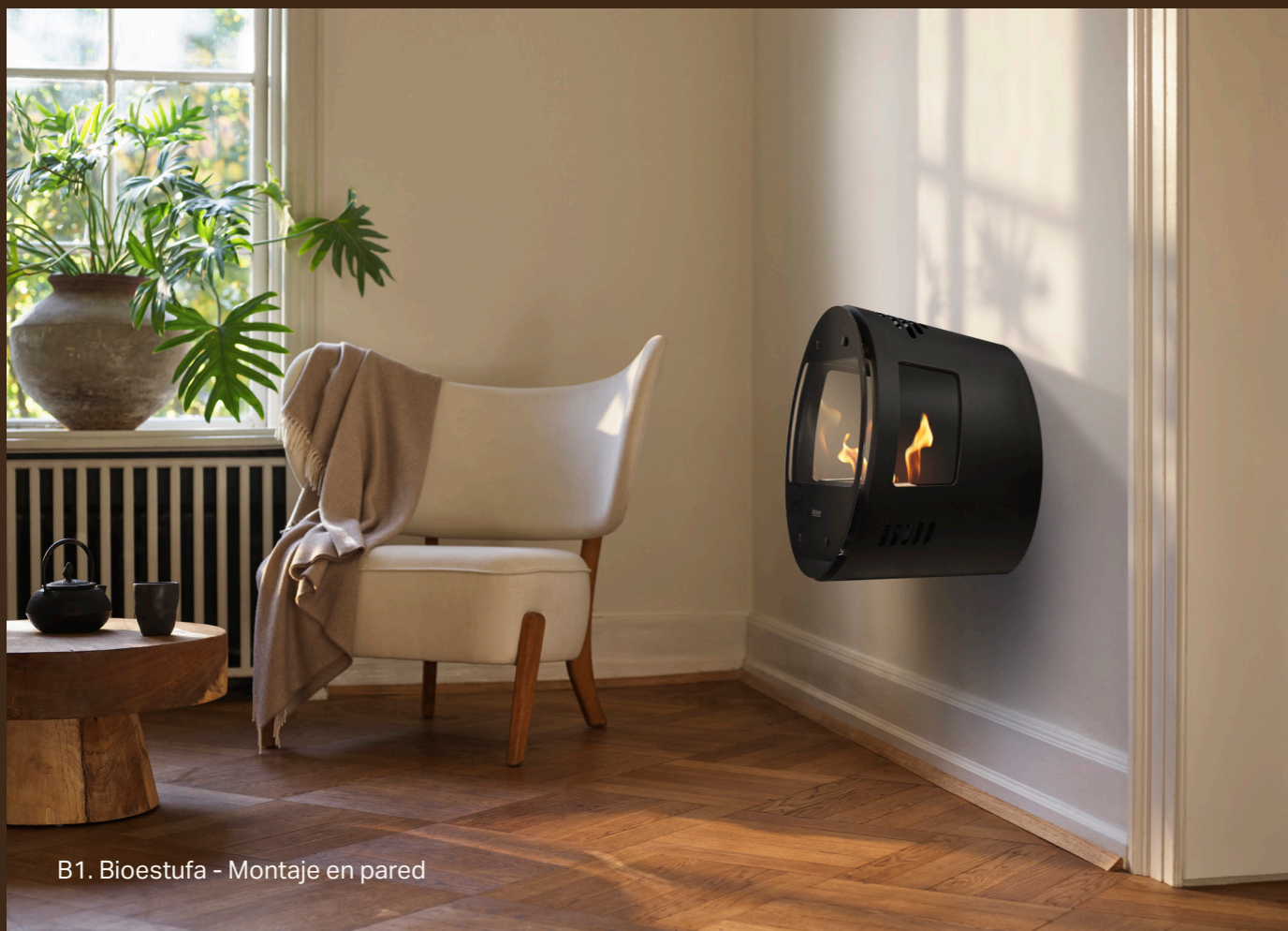
B1. Bioestufa - Montaje en pared