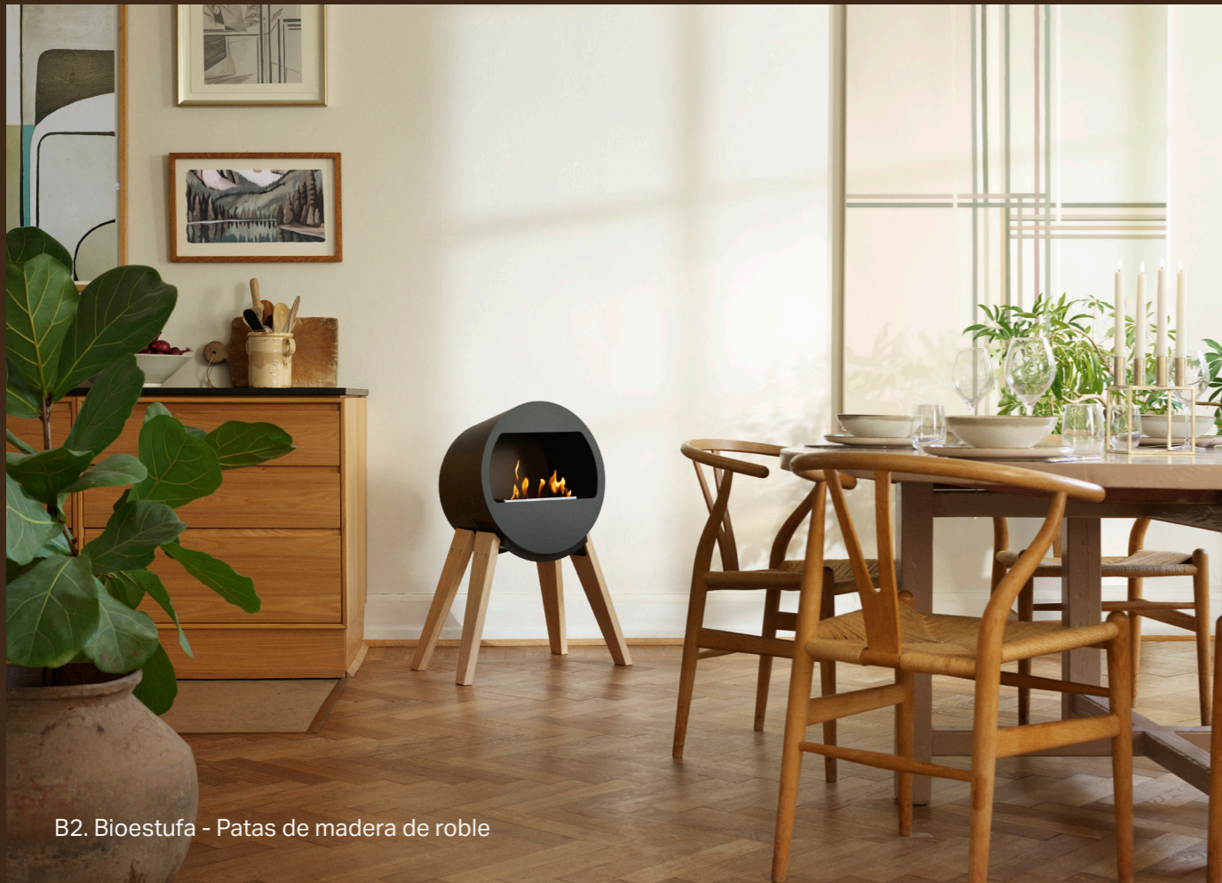
B2. Bioestufa - Patas de madera de roble