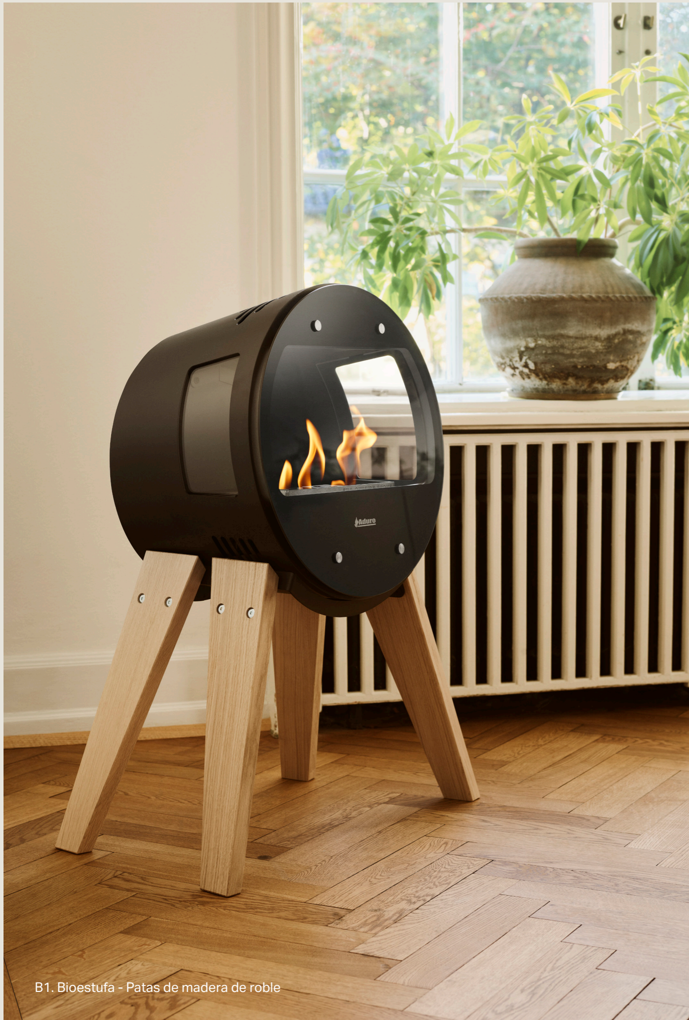
B1. Bioestufa - Patas de madera de roble