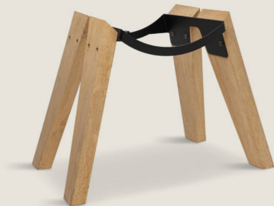
Patas de madera de roble